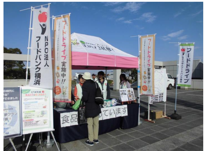
2018年12月1日、日産スタジアムにて

お米・レトルト・調味料・麺類・インスタントラーメン・缶詰・珈琲紅茶・お茶・お菓子・ペット飲料等の食品から、石鹼洗剤・タオル等、常温保存出来る食品食材及び日用雑貨品。